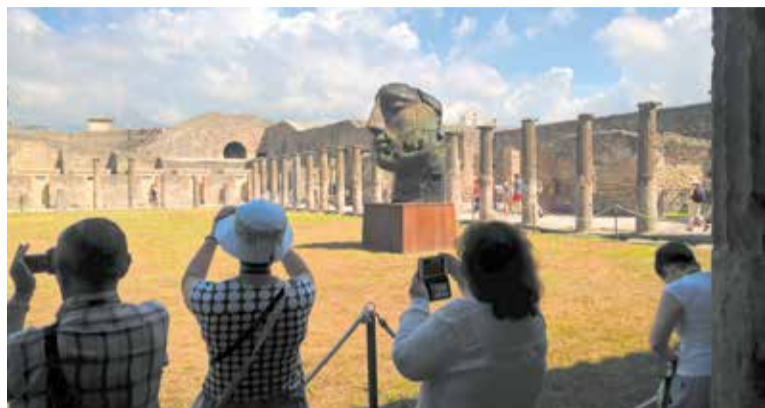
Turyści w Pompejach

► Akademia Podróży Wojazer zaprasza do udziału w wyjazdach dedykowanych osobom w wieku 50+ i 60+, które uwzględniają odpowiednie tempo, potrzeby, zainteresowania i integrację grupy. Program najbliższych wycieczek: 14-15.02 – Walentynki w Zachodniopomorskiem (autokar); 5-8.03 – Kaziuki w Wilnie (autokar), 14.03 – Dzień Kobiet (autokar), 28.03 – Powitanie Wiosny (autokar), 28.03-5.04 – Portugalia – Lizbona i okolice (samolot). Zapisy i szczegółowe informacje: Akademia Podróży Wojazer, ul. Dąbrowskiego 28a, tel. 61 662 84 03, biuro@akademiawojazer.pl (biuro czynne: pon. w g. 12-18, wt. i czw. w g. 11-18, pt. w g. 11-16). Informacje o wyjazdach jednodniowych dostępne na: www.akademiawojazer.pl . *MPS