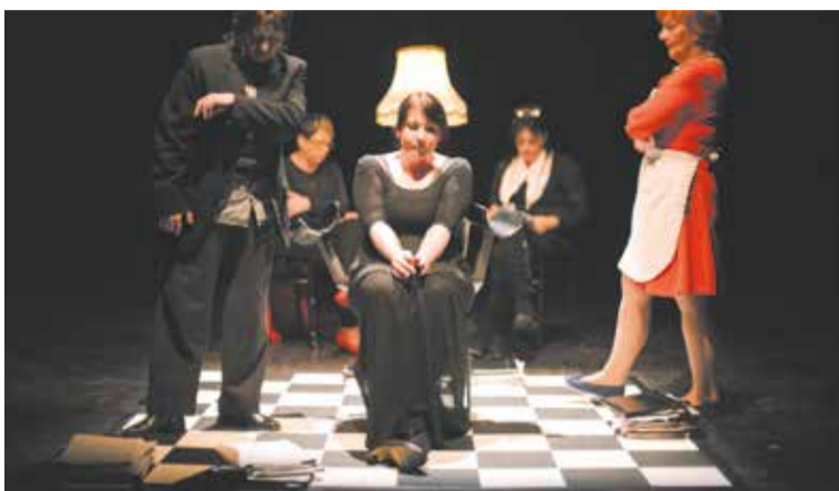
Teatr Ósmego Dnia, Wiera Gra

► Teatr Ósmego Dnia przygotował w styczniu cztery spektakle (Bilety na hasło „Senioralni” w cenie 5 zł). Ostatni spektakl (Circus Ferus) to rzecz o zmaganiach niezależnej grupy teatralnej z trudną współczesną rzeczywistością (10 i 11.01, g. 19). Obca (Fundacja Banina) stanowi literacki zapis przeżyć, które stały się udziałem młodej Ukrainki, tytuło-