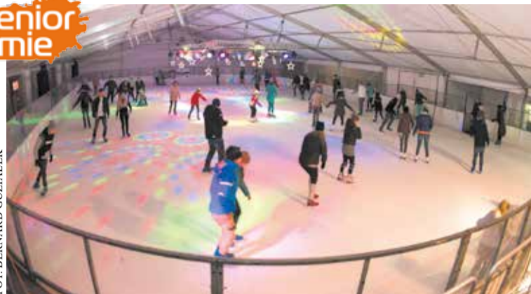
Lodowisko nad Malta

► Lodowisko Chwiałka POSiR. Posiadacze Poznańskiej Złotej Karty oraz legitymacji emeryta-rencisty mogą kupić bilet na 45 min wstępu na lodowisko w cenie biletu ulgowego. Koszt biletu, w zależności od dnia tygodnia i pory dnia, waha się od 8 do 21 zł. Koszt wypożyczenia łyżew na lodowisku to 10 zł za tercję. Kontakt: ul. Żelazka 1, tel. 61 831 67 16.