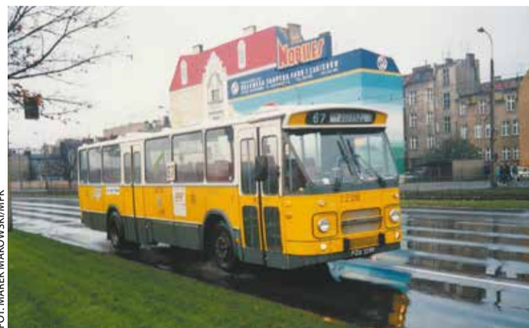
DAF MB200 na ulicach Poznania, lata 90. XX w.

oraz podwozia, zawieszenia i układu hamulcowego. Wymieniono podłogę i wykładzinę podłogową, porysowane szyby, uszczelki w oknach i drzwiach, laminaty boczne i wiatrolapy w przestrzeni pasażerskiej, odnowiono i obszyto na nowo siedzenia. Jednocześnie przywrócono autentyczne holenderskie przyciski i przełączniki, zamontowano oryginalne drzwiczki do kabiny kierowcy.