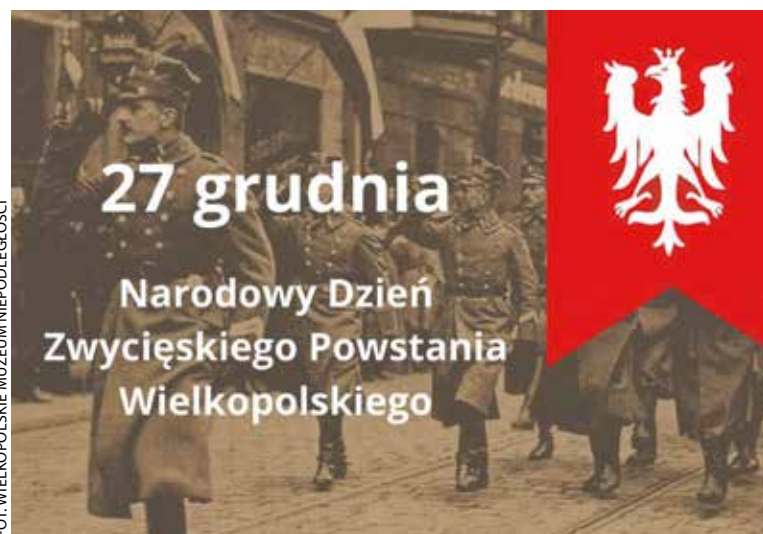
Powstanie Wielkopolskie zostało podniesione do rangi święta państwowego,

14 września projekt ustawy trafił do Sejmu, a 1 października wszyscy posłowie obecni na posiedzeniu zagłosowali za jej przyjęciem. 28 października jednogłośnie przyjął