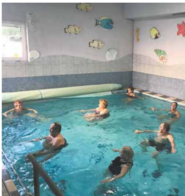
Zajęcia aqua fitness