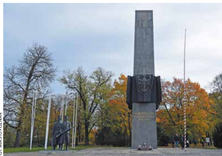
Pomnik Powstańców Wielkopolskich w Poznaniu

W rocznicę wybuchu powstania obchody zorganizują Urząd Marszałkowski Województwa Wiel-