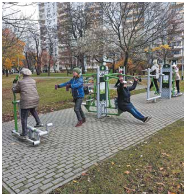
Nordic walking nad Małą