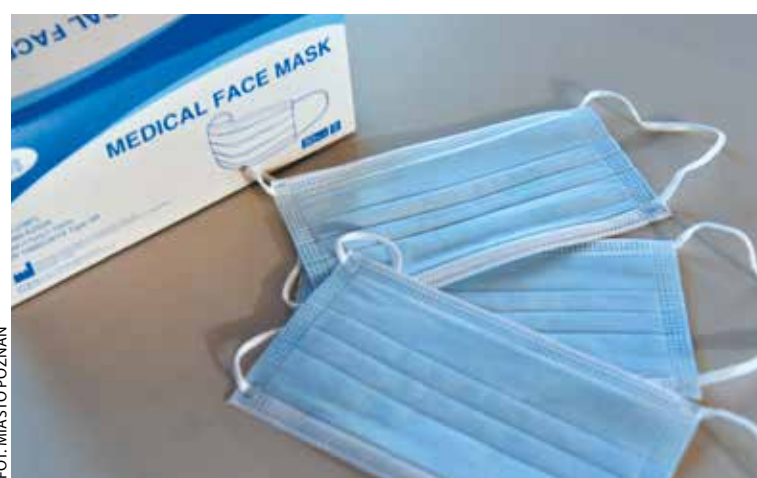
Noszenie maseczek w większości zamkniętych pomieszczeń jest nadal obowiązkowe

– Osoba, która nie dopełnia obowiązku zakrywania nosa i ust, może zostać ukarana mandatem w wysokości do 500 zł – wyjaśnia Prze-