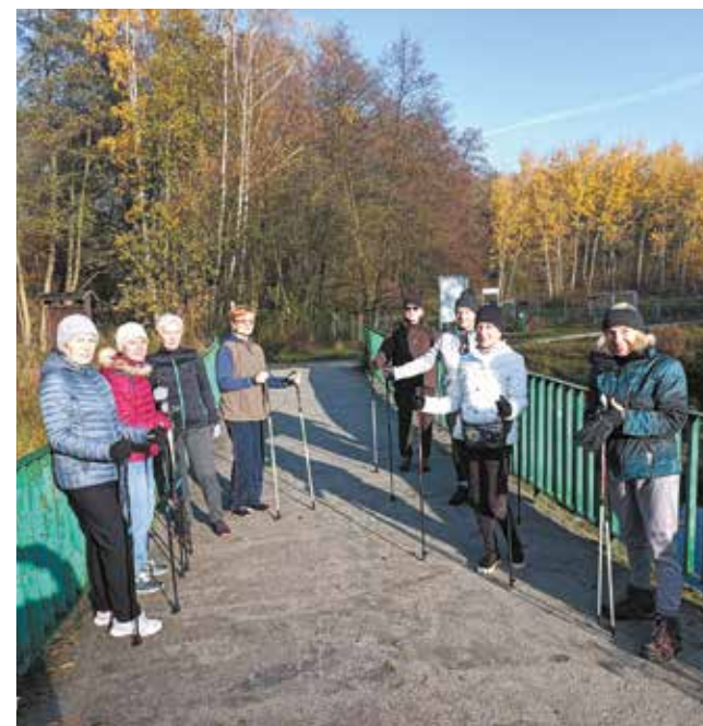
Ćwiczenia na siłowni zewnętrznej

Znany wynik 10. edycji Poznańskiego Budżetu Obywatelskiego . Oddano 85 tys. ważnych głosów, a do realizacji (już w przyszłym roku) zakwalifikowało się 35 projektów: 3 ogólnomiejskie i 32 rejonowe. Wśród nich jest wiele inicjatyw adresowanych do seniorów.