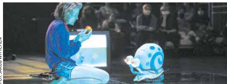
Scena Robocza, spektakl Żyjesz naprawdę w innym świecie