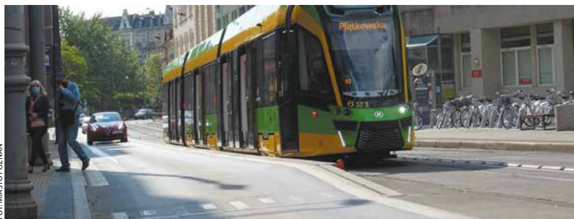
Przystanek wiedeński w Poznaniu