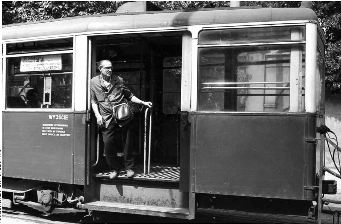
Kontroler biletów w tramwaju na ul. Szanieckiej, 1967 r.

Już 4 marca 1945 roku w zniszczonym Poznaniu ruszył pierwszy tramwaj. Oczywiście był w nim konduktor zarówno sprzedający, jak i kasujący bilety. Na początku lat 50. powszechne stały się tramwaje typu „N”, tzw. trumny, które zwykle jeździły z otwartymi drzwiami. Powszechna w tym czasie była jazda „na winogrono” oraz wskakiwanie