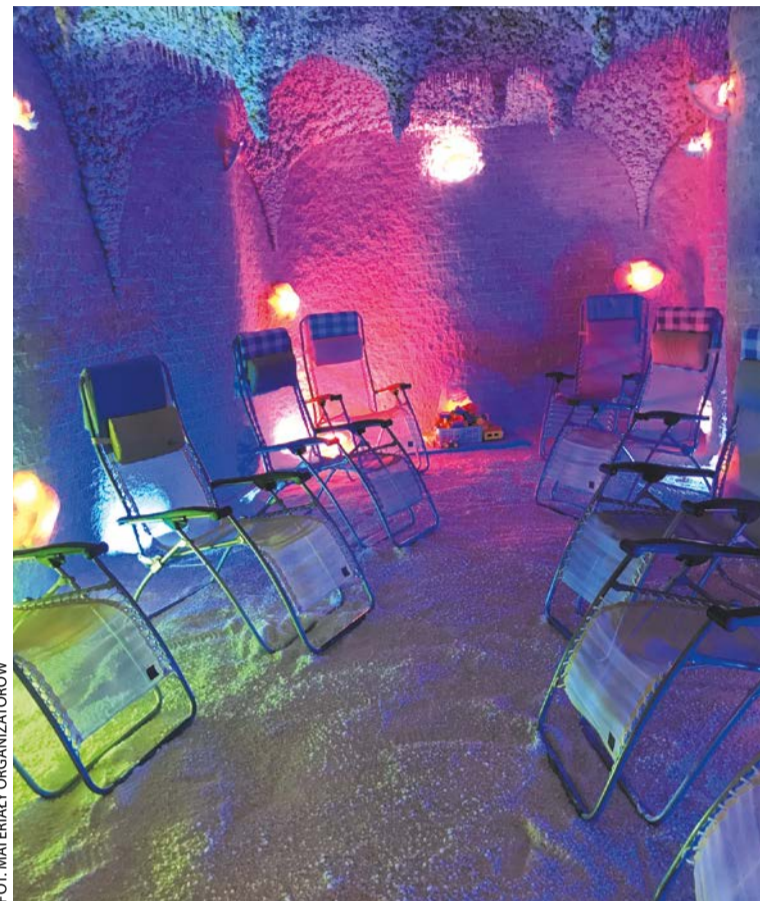
Grota solna Galos

W sierpniu dostępna jest konsultacja endokrynologiczna z USG tarczycy w promocyjnej cenie (220 zł) – z oferty można skorzystać w placówce przy ul. Starołęckiej 42 (tel. 61 227 58 10). Ponadto seniorzy mogą skorzystać z 25 proc. rabatu na badania laboratoryjne: morfologia, glukoza, witamina D3, TSH, cholesterol całkowity. Promocja dostępna we wszystkich placówkach Med Polonia: ul. Obornicka 262 (tel. 61 664 33 00), ul. Błacharska 2 (tel. 61 664 33 34), ul. Starołęcka 42 (tel. 61 227 58 10).