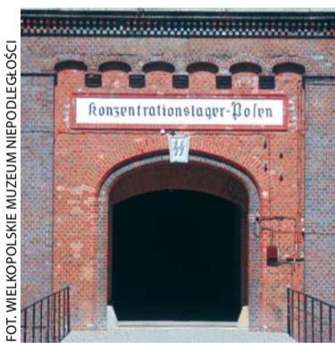
Muzeum Martyrologii Wielkopolan – Fort VII

O tym, jak potężne żywioly kształtowały miasto, będą mogli usłyszeć uczestnicy rodzinnej przechadzki Szlakiem żywiolów w dziejach historii Poznania , do udziału w której zaprasza Wielkopolskie Muzeum Niepodległości. Spacer odbędzie się 5.08 o g. 15 (zbiórka: pl. Kolegiacki, przy fontannie) i potrwa około godziny, udział bezpłatny, nie obowiązują zapisy. Dodatkowo 19.08 w g. 11–16 z okazji Święta Wojska Polskiego odbędzie się Dzień Techniki Militarnej. WMN zaprasza do zwiedzania ekspozycji plenerowej