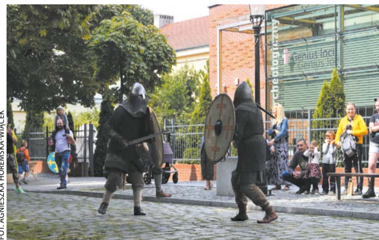
Inscenizacja walki wczesnośredniowiecznych wojów

cheologiczny zaprasza do wspólnych obchodów Dni Twierdzy Poznań (26.08 w g. 10–18, 27.08 w g. 10–15). Na zwiedzających czekać będzie wiele atrakcji plenerowych: archeologiczna piaskownica, strefa relaksu, bicie średniowiecznych monet, gra terenowa, obóz wojów wczesnośredniowiecznych. Harmonogram wydarzeń: 26.08, g. 12.30 – zmiana warty u wejścia do palatium księcia Mieszka I, g. 13 – zwiedzanie ekspozycji palatium i kościoła NMP z postaciami historycznymi, g. 15 – pokazy walk wojów, g. 17 – spacer archeologiczny śladami gotyku Ostrowa Tumskiego; 27.08, g. 11 – zmiana warty u wejścia do palatium księcia Mieszka I, g. 13 – pokazy walk wojów, g. 13.30 – zwiedzanie z archeologiem ekspozycji wałów