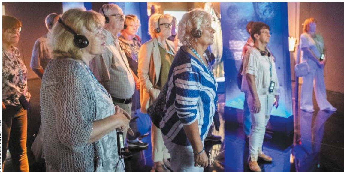
Ostrów Tumski przez wieki, oprowadzanie dla seniorek i seniorów

Przez osiem stuleci, jakie upłynęły od momentu lokacji Poznania, stał się on domem dla wielu ludzi. To oni sprawiali, że miasto rozwijało się i tętniło życiem. Galeria zaprasza na nową wystawę Siła spotkania. O ludziach, którzy tworzyli Poznań (dostępna do 26.11, wt.–pt., g. 9–18, sob.–niedz., g. 10–19, wstęp wolny). Wydarzenia towarzyszące wystawie: 6.08, g. 11.30 – Szlak Dziedzictwa Żydowskiego : wycieczka tematyczna. Spośród wielu społeczności, które budowały dziedzictwo Poznania, istotne miejsce zajmują Żydzi.