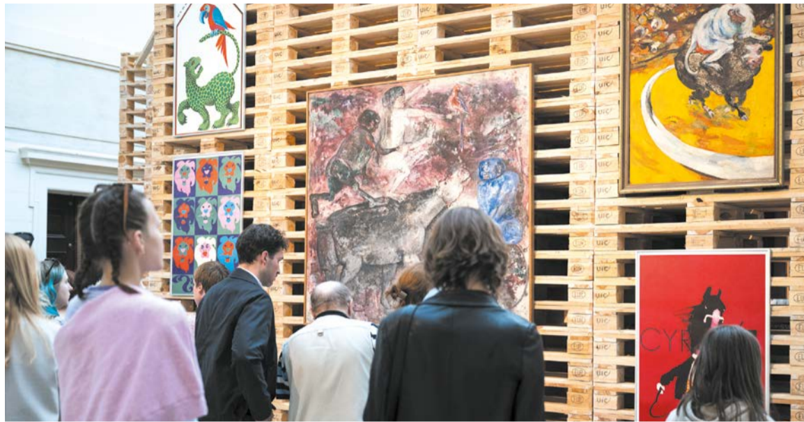
Wystawa Zwierzę przede mną

Muzeum Narodowe w Poznaniu zaprasza do siebie oraz swoich oddziałów