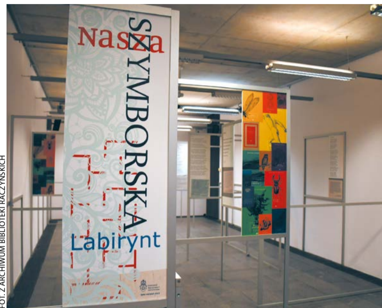
FOT. Z ARCHIWUM BIBLIOTEKI RACZYŃSKICH

szą książka Źródłisko ); 25.08, g. 18 – Klub Książki u Raczyńskich, Filia Sztuki (w sierpniu uczestniczki i uczestnicy książkowego spotkania wyjdą słońcu naprzeciw, bo wybiorą się do Indii wraz z powieścią Biały tygrys , za którą jej autor Aravind Adiga został w 2008 roku wyróżniony Nagrodą Bookera, książka dostępna jest w filiach: wypożyczalnia, Al. Marcinkowskiego 23; Filia 2, os. Oświęcienia 59; Filia 11, ul. Chwaliszewo 17/23; Filia 12/46, ul. Arciszewskiego 27; Filia 14, os. Bolesława Chrobrego „Dąbrówka”; Filia 15, ul. Fabiano-wo 2; Filia 16, ul. Muszkowska 1A; Filia 26, ul. Błękitna 1/7; Filia 35, ul. Druskiennicka 32; Filia 42, os. Pod Lipami; Filia 51, os. Lecha 15; Filia 56, ul. Galileusza 8). Wysta-