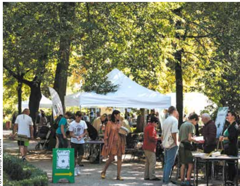
Ubiegłoroczna edycja Targu Dobra

Kolejna edycja Poznańskiego Targu Dobra odbędzie się w niedzielę 3 września w Starym Zoo (ul. Zwierzyniecka), w g. 10–16.