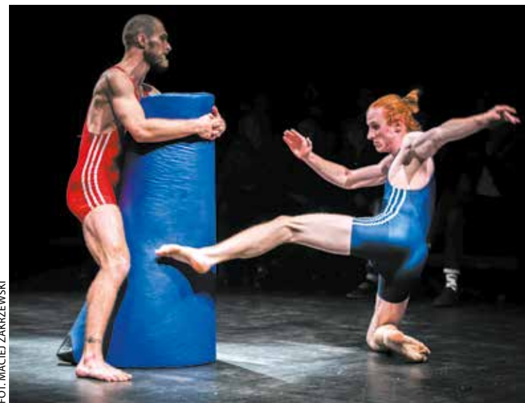
Spektakl Bromance , Scena Robocza

Co się stanie po usunięciu ściany? Czy chłopaki naprawdę nie płaczą? Spektakle Sceny Roboczej we wrześniu: 15-16.09, g. 19 – Puppetwall (spektakl lalkowy dla dorosłych, historia o wspólnocie zagubienia i osamotnienia, a także potrzebie drugiego człowieka, która daje siłę na burzenie ścian między sobą, Studio Scena Robocza, ul. Wroniecka 6); 21.09, g. 19 – Bromance