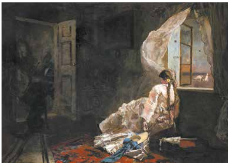
Józef Chełmoński, Wieczór letni

Góra Przemysła 1, tel. 61 856 80 75, czynne: wt.-śr. w g. 10-16, czw. w g. 10-18, pt. w g. 10-20, sob.-niedz. w g. 10-17, bilety na wystawę stałą: 20/13 zł (we wtorki wstęp wolny na stałe wystawy). Od 1.09 do 17.03 w muzeum dostępna będzie wystawa czasowa Nie zmarnujcie niepodległości. Srebra Funduszu Obrony Narodowej.