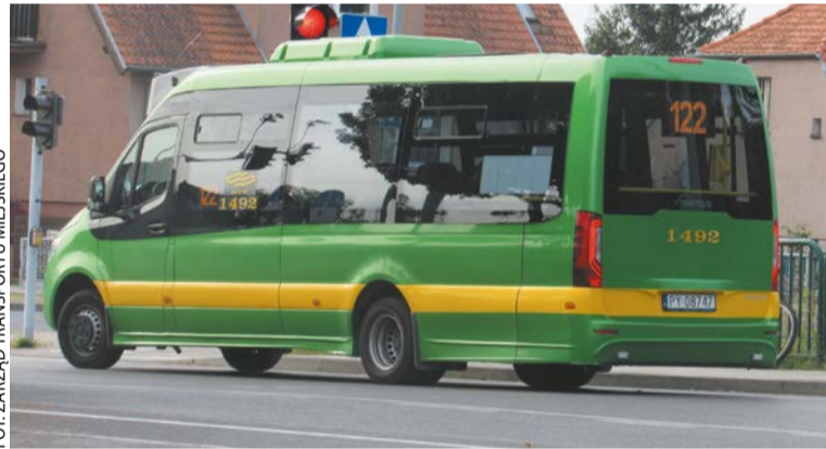
Linia autobusowa nr 122 obsługiwana przez minibus

Trasa linii nr 122 prowadzi z pętli na Junikowie, a dalej ulicami: Grunwaldzką – Wieruszowską – Ziębicką – Grunwaldzką – Smoluchowskiego – Kamiennogórską – Dziewińską –