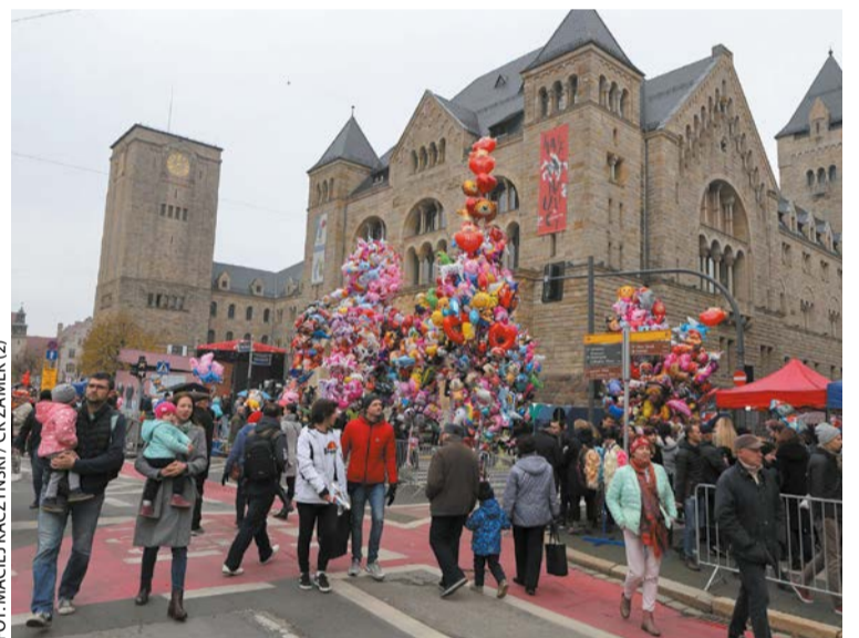
Imieniny ulicy Święty Marcin