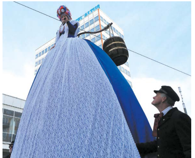
Bamberka na paradzie świętomarcinińskiej

Szczegóły: CK Zamek, ul. Św. Marcina 80/82, informacja: tel. 61 646 52 72, www.ckzamek.pl