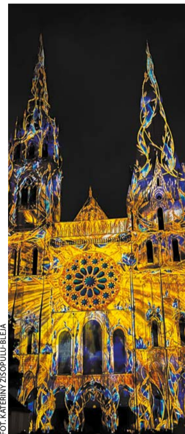
Iluminacje katedry w Chartres

Cały czas można zwiedzać wystawę z cyklu Bliskie spotkania z... Dwa grody w Dąbrówce nad Wirynką – dawne i nowe badania , która pokazuje możliwości analizy pozyskanego materiału zabytkowego z zastosowaniem metod badawczych z różnych dyscyplin naukowych (dostępna do 15.12, I piętro pałacu Górków, wstęp po zakupie biletu do muzeum). Kolejną wystawą z tego cyklu będzie: A były tam smoki? Wybrane stwory z legend i ich przedstawienia na zabytkach archeologicznych , która będzie opowiadać o mitycznych stworach, pojawiających się w legendach i bestiariach. Wystawa dostępna w terminie 15.12.23–29.02.24 na I piętrze pałacu Górków (wstęp po zakupie biletu do muzeum).