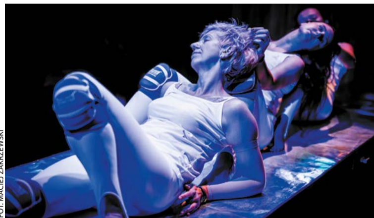
Spektakl Pentezylea w Scenie Roboczej

Obraz współczesnych Amazonek i kabaret z dawnych lat – Scena Robocza zaprasza na spektakle w grudniu: 1–2.12, g. 19 – Pentezylea. Rekonstrukcja ciała Amazonek (spektakl zestawia historię królowej Amazonek z kondycją Amazonek współczesnych – osób przechodzących rehabilitację po leczeniu raka piersi, Teatr Ósmego Dnia w Poznaniu, ul. Ratajczaka 44); 7–9.12, g. 19 – Nasza Racja (powrót kabaretu lat 20. XX wieku, Studio Scena Robocza, ul. Wroniecka 6). Bilety dla seniorów: 30 zł, do nabycia przez stronę bilety24.pl oraz na miejscu 30 mi-