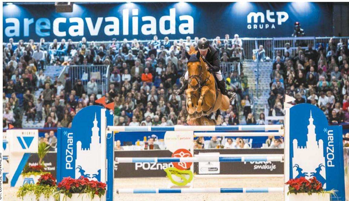
Zawody w ramach Cavaliady

Turniej Lech Cup rozpocznie się od rywalizacji zespołów systemem każdy z każdym. Drugiego dnia zmagają zgodnie z osiągniętymi wynikami utworzone zostaną dwie grupy: tzw. Liga Mistrzów i Liga Europy. O miejsca 1-4, a co za tym idzie końcowy triumf, walczyć będą drużyny pierwszej z grup. W ostatnich kilku latach mogliśmy oglądać bardzo dobre występy gospodarzy turnieju. Młodzi reprezentanci Kolejorza w zeszłym roku zajęli trzecie miejsce – podobnie było w latach 2013, 2018, 2019 i 2021. Największy sukces lechici odnieśli w 2017 roku, kiedy to po raz pierwszy i do tej pory ostatni zwyciężyli w turnieju, pokonując w finałowym spotkaniu Chelsea Londyn po serii rzutów karnych. Kibice, którzy pojawią się na trybunach hali UAM