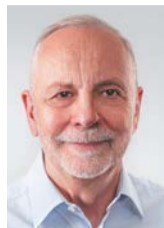
Rafał Grupański (Senat)