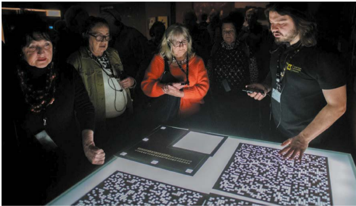
Płachty Zygałskiego w Centrum Szyfrów Enigma

Grudzień z Poznańskim Centrum Dziedzictwa: