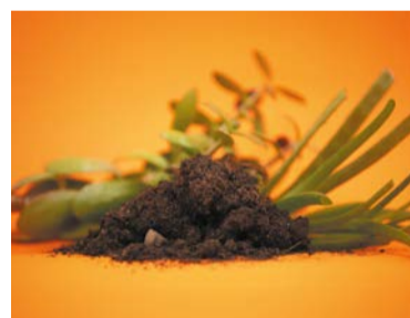
Odpady bio wyrzucamy oddzielnie

żółtego pojemnika. Podobnie – do tworzyw sztucznych – wyrzucamy wspomniane tetrapaki, czyli kartony po napojach. Są to opakowania wielomateriałowe, przetwarzane inaczej niż papier.