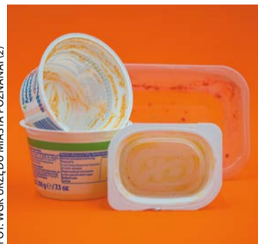
Opakowań plastikowych nie trzeba myć

Opakowań z tworzyw sztucznych i szkła nie trzeba myć. Ważne jest, by wyrzucać opakowania opróżnione z zawartości, ale mogą być one zabrudzone resztkami. Chodzi tu zarówno o tworzywa sztuczne, opakowania szklane, jak i tetrapaki. Wyrzucając plastikowe butelki, pamiętajmy, by odkręcić zakrętki, a samą butelkę zgnieść, by zajmowała jak najmniej miejsca. Przed wyrzuceniem słoików i szklanych butelek także należy odkręcić pokrywki i kapsle – te trafiają do