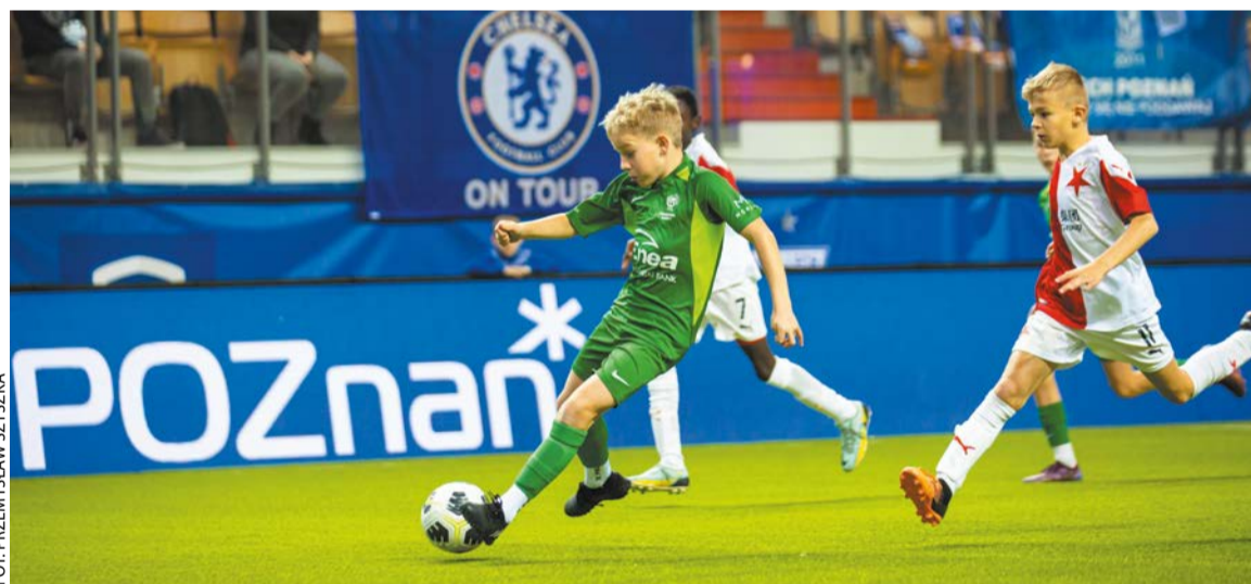
Turniej Enea Lech Cup

na Morasku, będą mogli na własne oczy zobaczyć w akcji młode talenty piłkarskie, wiedząc, że za kilka lat ci zawodnicy wybiegną na murawy znanych stadionów.