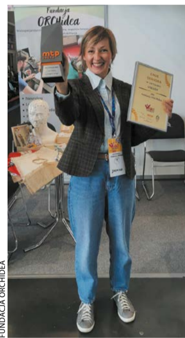
Laur Seniora dla Fundacji ORCHidea