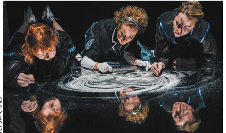
Macocha w Teatrze Polskim

Teatr Polski poleca spektakle w grudniu: 1–2.12, g. 19 i 3.12, g. 18 – Macocha (w spektaklu podjęto próbę zdekonstruowania wizerunku macochy); 7–9.12, g. 19, 10.12, g. 18 – Kordian i cham. Powidok folwarczny (spektakl staje się przyczynkiem do śledzenia modeli folwarcznych w codziennej rzeczywistości). Na powyższe spektakle (w podanych terminach) bilety dla