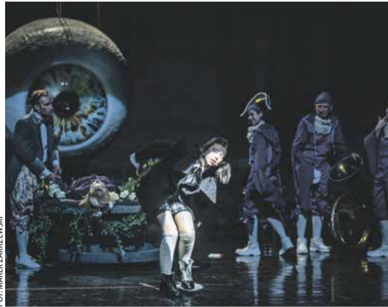
Śnieżka nie chce spać

Teatr Polski zaprasza na lutowe przedstawienia.