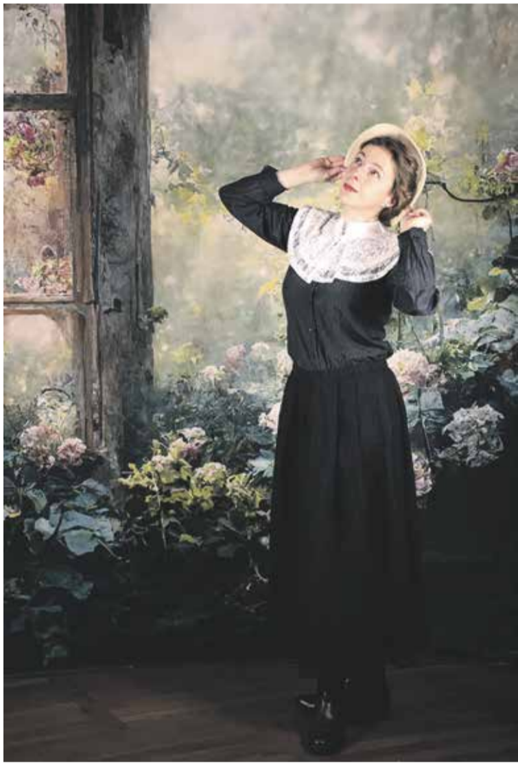
Wystawa Rodzina Połanieckich

Muzeum Literackie Henryka Sienkiewicza, oddział Biblioteki Raczyńskich, Stary Rynek 84, tel. 61 852 89 71, czynne: wt.-sob. w g. 9-16, bilety: 4/2 zł, w soboty wstęp bezpłatny