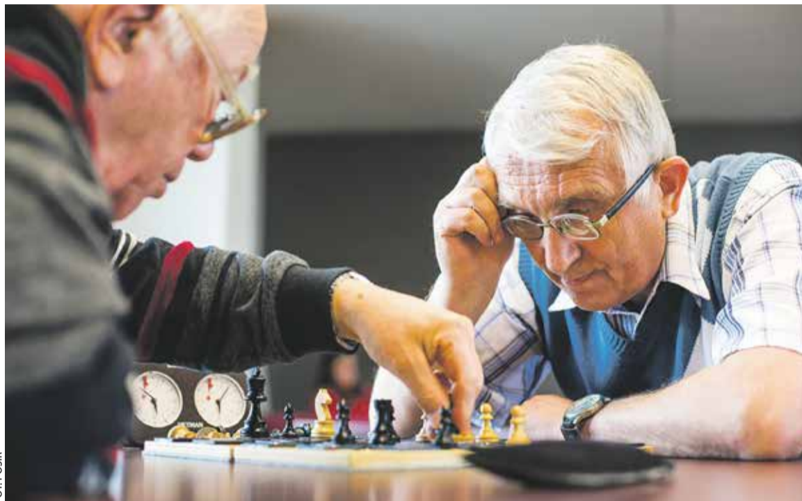
Zajęcia szachowe odbywają się w każdą pierwszą środę miesiąca

Każdy drugi wtorek miesiąca – g. 16 – Pływalnia Miejska Atlantis, os. Stefana Batorego 101. Czas trwania zajęć – 2 godziny. Zajęcia plastyczne to doskonała zabawa dla dzieci i dorosłych. Zajęcia poprowadzi instruktor, który poka-