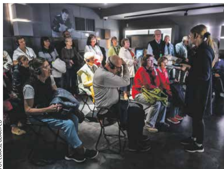
Szyfry przez wieki

Ciekawą propozycją jest walentynkowe oprowadzanie romantyczne, które rozpocznie się w Bramie Poznania 17.02 o g. 16. Udział w wydarzeniu jest bezpłatny, obowiązują zapisy, tel. 61 647 76 34. Odbędzie się także bezpłatne oprowadzanie dla senierek i seniorów pt. Ostrów Tumski przez wieki . Data tego wydarzenia to 21.02, g. 16. Obowiązują zapisy: tel. 61 647 76 34. Z kolei Centrum Szyfrów Enigma zaprasza