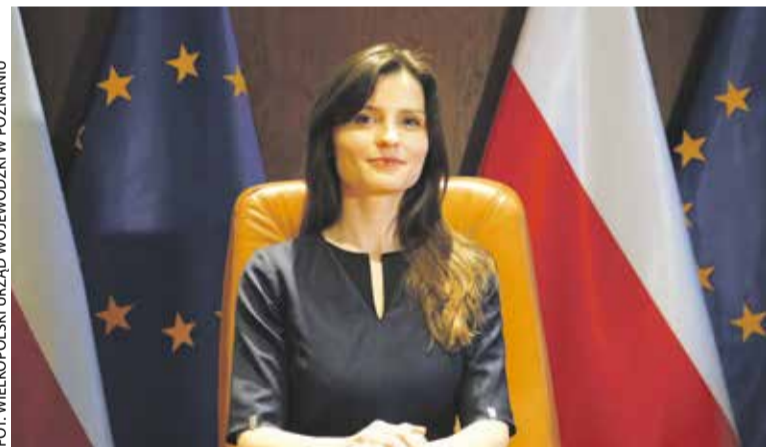
Wojewoda wielkopolska – Agata Sobczyk

Oficjalną nominację na stanowisko wojewody wielkopolskiego otrzymała 23 grudnia Agata Sobczyk, absolwentka Uniwersytetu Ekonomicznego w Poznaniu.