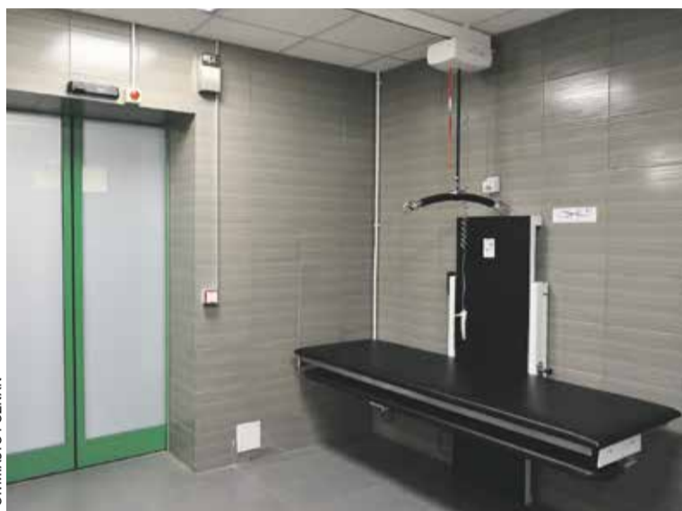
Komfortka na Dworcu Zachodnim

W Poznaniu miejsc, w których można komfortowo przewinąć lub zmienić bieliznę dorosłym, jest już kilkanaście. Najnowsza komfortka powstała pod koniec 2023 roku w toalecie na Dworcu Zachodnim, prowadzonej przez miejską jednostkę Usługi Komunalne. Znajduje się w niej wysokiej klasy łóżko z regulacją wysokości, a tak-