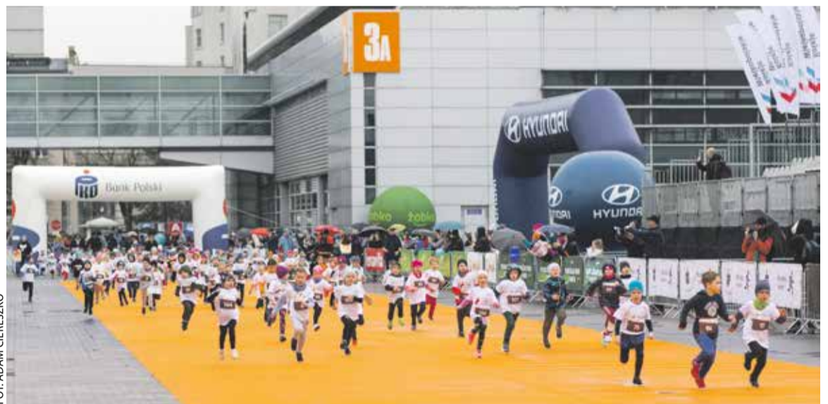
Bieg dla dzieci – jedna z imprez towarzyszących poznańskiemu Półmaratonowi

uczestnik Pho3nix Kids Półmaraton otrzyma medal, pamiątkową koszulkę oraz worek z upominkiem. Limit zapisów na Pho3nix Kids Półmaraton został już osiągnięty.