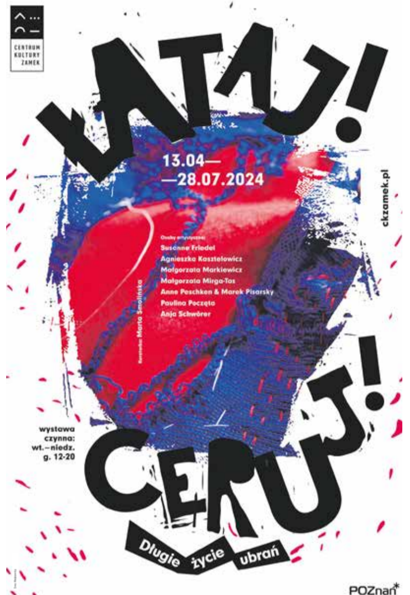
Wystawa Łataj! Ceruj! Długie życie ubrań

W Zamku prezentowane są także ciekawe wystawy: Zalóż to jeszcze raz – wystawa towarzysząca Łataj! Ceruj! Długie życie ubrań (czynna od 3.04 do 26.05, Hol Wielki, wstęp wolny); Królestwo Michała Bugalskiego (czynna do 26.05, Galeria Fotografii, obowiązuje bilet na zwiedzanie Zachodniego Skrzydła Zamku). Szczegóły: ul. Św. Marcin 80/82, informacje: tel. 61 646 52 72, www.ckzamek.pl.