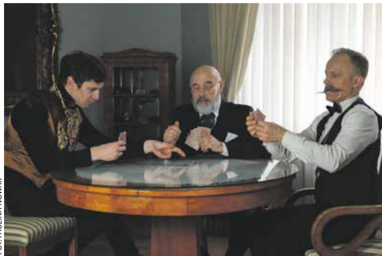
Wystawa Rodzina Połanieckich

20.04 o g. 12.30 będzie można wziąć udział w oprowadzaniu kuratorskim po wystawie Trójkąty miłosne u Sienkiewicza. Odsłona II: Rodzina Połanieckich . Kurator opowie nie tylko o tym, w jaki sposób Sienkiewicz wykorzystał schemat trójkąta miłosnego w swojej