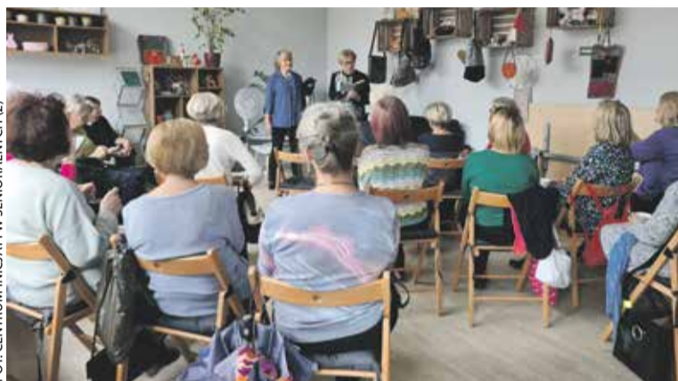
FOT. CENTRUM INICJATYW SENIORALNYCH (2)