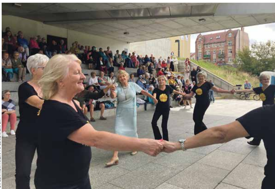
Jedno z wydarzeń w ramach programu „Senioralni. Poznań”