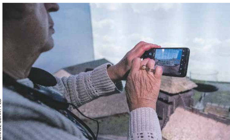
LUKASZ GDAK / PCD

Centrum Szyfrów Enigma zaprasza na oprowadzanie wydobywające na światło dzienne genialne kobiety, które wniosły unikatowy, a zwykle niedostrzegany wkład w rozwój świata i nauki. Wydarzenie pt. Prekursorki. Opowieść