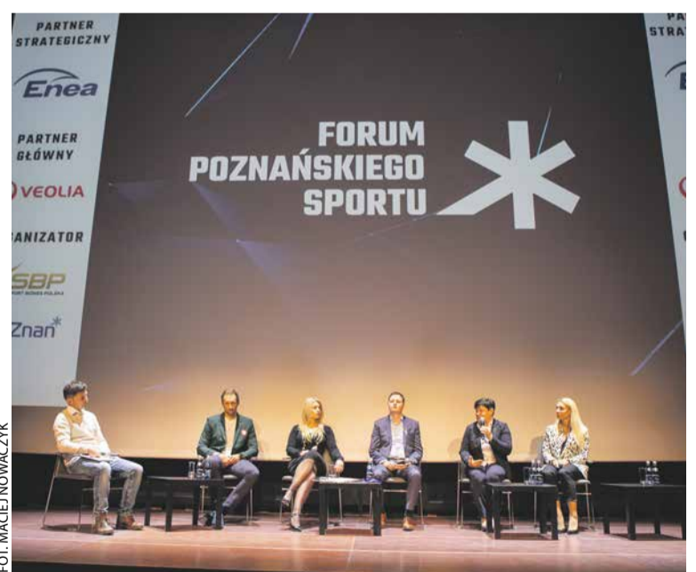
Forum Poznańskiego Sportu 2022