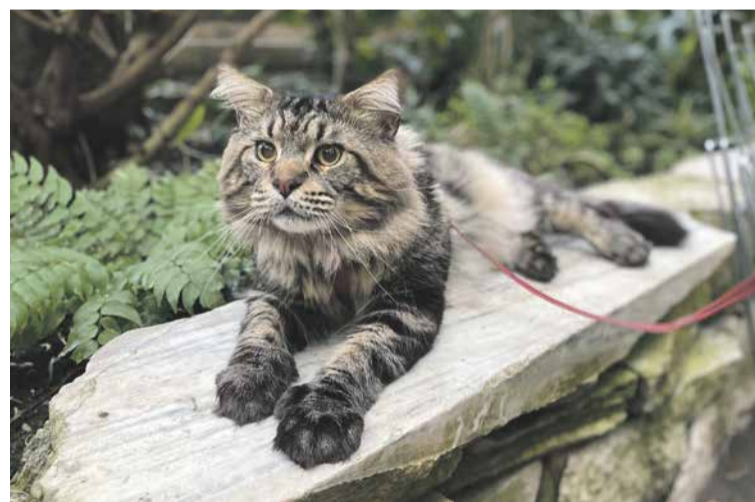
FOT. PALMIARNIA POZNAŃSKA

Poznańska Palmiarnia zaprasza na Pokaz Kotów Rasowych, który odbędzie się 10.03 w g. 10–16. Organizuje go Poznański Klub Kotów Rasowych „Amofeles”. Wstęp w cenie standardowego biletu. Z kolei 26.03 o g. 11 można wybrać się na spacer z przewodnikiem wśród roślinności palmiarnianych pawilonów. Obowiązują zapisy: tel. 514 652 476; 510 674 848, liczba miejsc ograniczona. Warto pamiętać, że w ramach akcji Wtorki Seniora w każdy wtorek bilety dla osób 60+ są w cenie 4 zł/os.