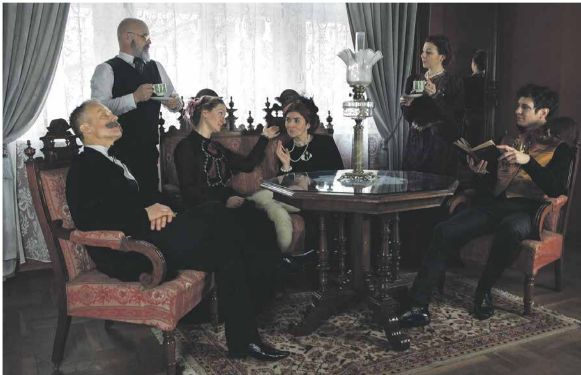
Wystawa Rodzina Połanieckich

Biblioteka Raczyńskich zaprasza na otwartą w lutym w Muzeum Literackim Henryka Sienkiewicza (Stary Rynek 84) wystawę czasową Trójkąty miłosne u Sienkiewicza. Odłona II: „Rodzina Połanieckich” .