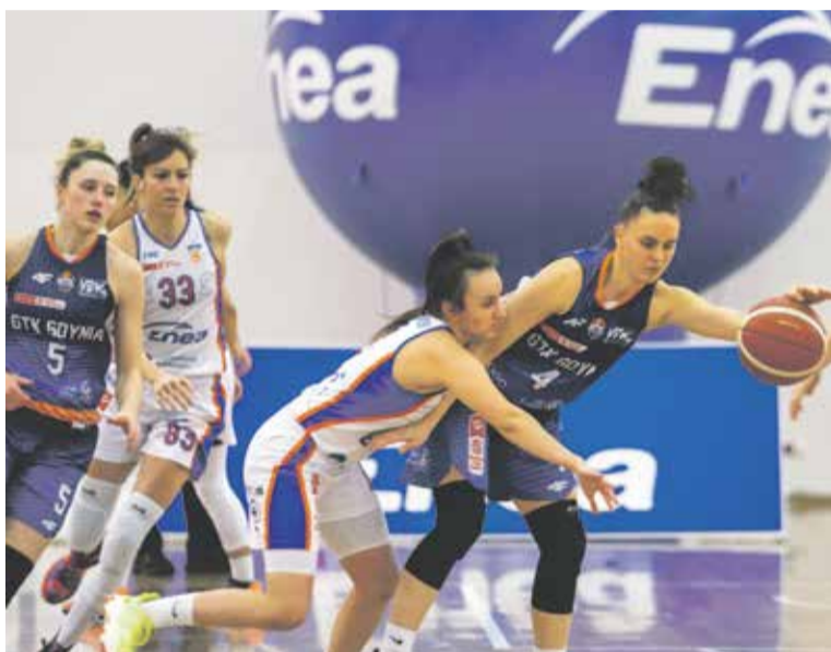
Enea AZS Politechnika

Tegoroczne lato obfitowało w emocje sportowe – najpierw żyliśmy zmaganiem w piłce nożnej podczas EURO 2024, a na przełomie lipca i sierpnia śledziliśmy rywalizację w kilkudziesięciu dyscyplinach podczas XXXIII Letnich Igrzysk Olimpijskich w Paryżu. Świat sportowy jednak nie znosi próżni i już we wrześniu do rywalizacji powrócą poznańskie zespoły w ramach rozgrywek ligowych.