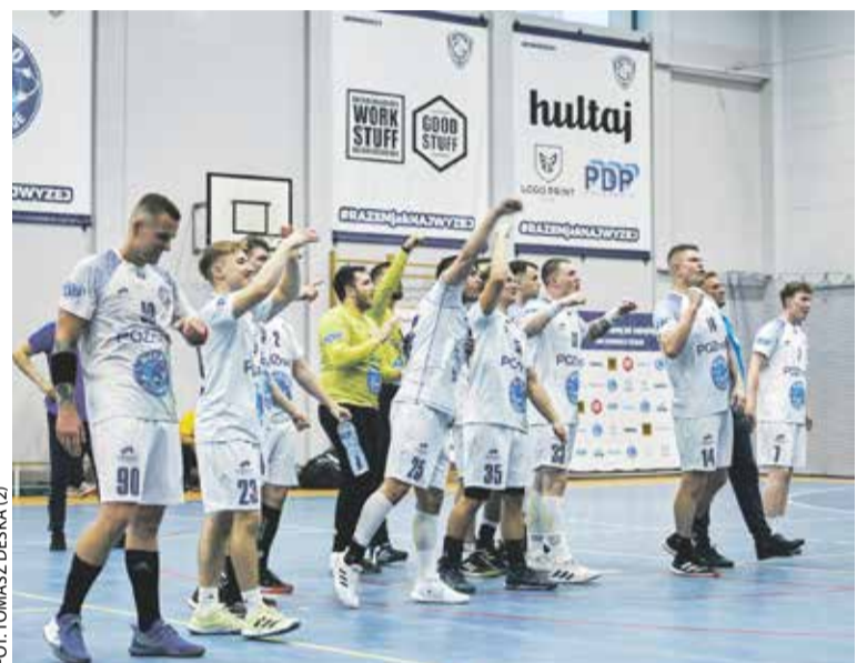
WKS Grunwald 3

Poznańskie kluby koszykarskie słyną ze znakomitego szkolenia młodzieży. Drużyny juniorskie z naszego miasta regularnie zdobywają medale młodzieżowych mistrzostw Polski. Dla przykładu, w minionym sezonie 2023/2024 w kategorii dziewcząt do lat 17 w meczu o tytuł mistrzowski wystąpiły koszykarki Enei AZS Poznań oraz Quay MUKS Poznań. Fanom koszykówki z pewnością marzy się sytuacja, w której poznański zespół powalczy o medal mistrzostw Polski na poziomie seniorskim. Temu wyzwaniu spróbują sprostać koszykarki Enei AZS Politechniki Poznańskiej, które kolejny raz wystąpią na najwyższym szczeblu rozgrywkowym w kraju. Ostatnie dwa sezony w wykonaniu poznańskich „akademiczek” były przyzwoite, ale niestety w obu przypadkach kończyły się na pierwszej rundzie play-off. Być może nadchodzący sezon będzie tym, w którym uda zrobić się kolejny krok w przód i pokonać w play-offach pierwszą przeszkodę. Oznaczałoby to wejście do strefy medalowej i walkę o końcowe laury. W sezonie 2023/2024 najlepsze okazały się koszykarki KGHM BC Polkowice, które pokonały w finałowej rywalizacji