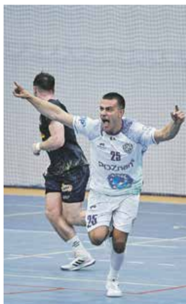
WKS Grunwald 3