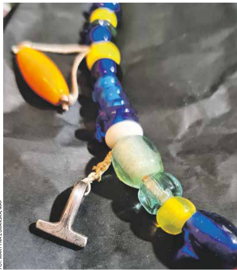
Rekonstrukcja kolii wczesnośredniowiecznej