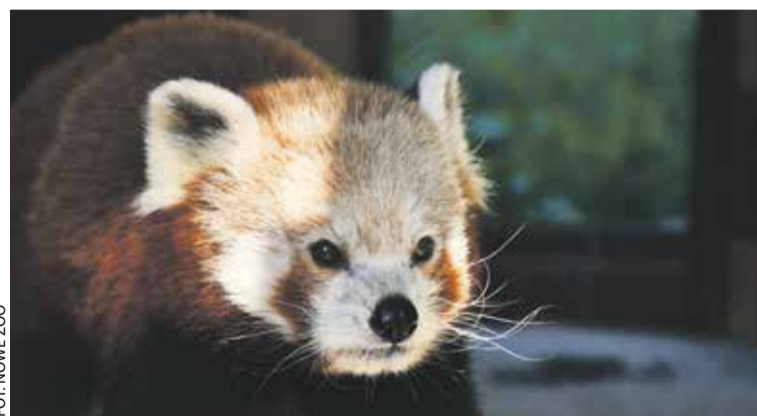
Toshi – samiec pandki rudej z Nowego Zoo w Poznaniu

Wydarzenie w ramach cyklu Dzień Seniora w Nowym Zoo . Spacer potrwa około godziny. Po spacerze będzie czas do samodzielnego odkrywania zwierząt