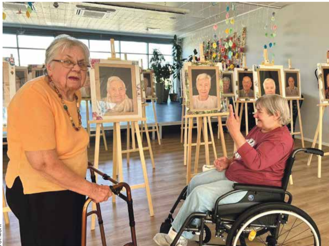
Wystawa fotografii Familia na zdjęciach w DPS na Strzeszynie

Do końca lat 80. pomoc społeczna opierała się na zapisach ustawy z 1923 roku. Ważnym krokiem w zreformowaniu tego obszaru było utworzenie ośrodków pomocy społecznej. Następnie w kwietniu 1990 roku opieka społeczna została przeniesiona z resortu zdrowia do resortu pracy, a w listopadzie przyjęto ustawę o pomocy, która terminem „opieka społeczna” zastąpiła określenie „pomoc społeczna”. Założeniem pomocy społecznej było niwelowanie negatywnych skutków transformacji – bezrobocia, zjawiska patologii społecznej, obniżenia standardów życiowych.