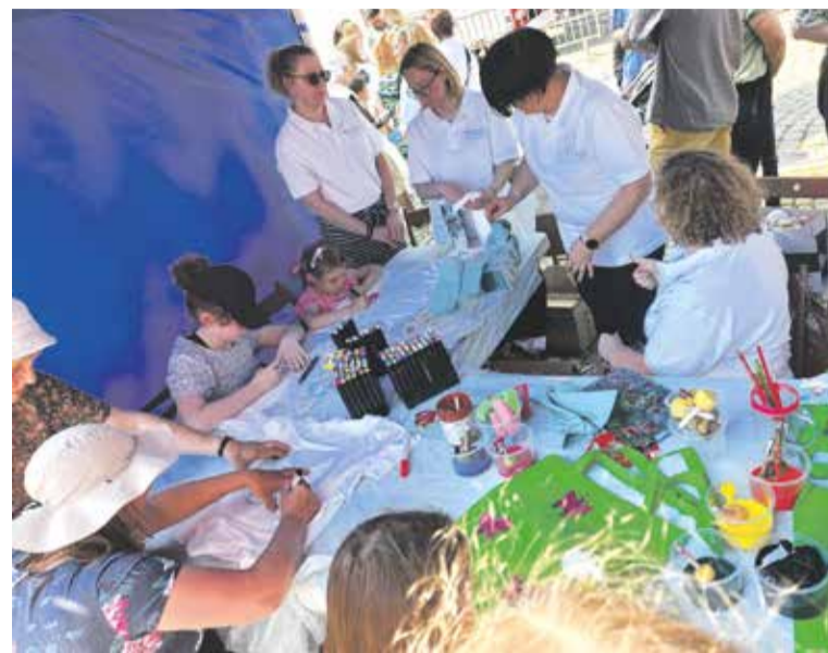
Stanowisko MOPR na festynie miejskim

Pandemia wymagała zmiany metod pracy – z kontaktu bezpośredniego z klientem na kontakt zdalny. Pogłębiła wykluczenie klientów pomocy społecznej. Po wsparcie częściej niż dotychczas zgłaszały się osoby bezdomne, bezrobotne, starsze, niesamodzielne, niewydolne w wypełnianiu funkcji opiekuńczo-wychowawczych, doświadczające przemocy domowej